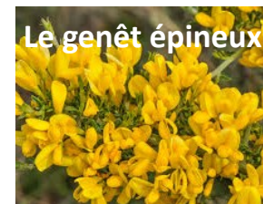
Le genêt épineux

Le parcours fait une boucle et repart par le chemin emprunté au départ.