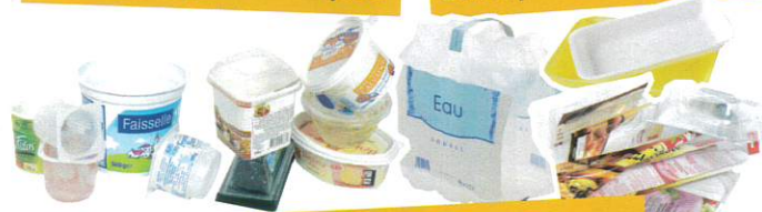
Les pots, barquettes et films plastiques

INUTILE DE LES LAVER, IL SUFFIT DE LES VIDER!