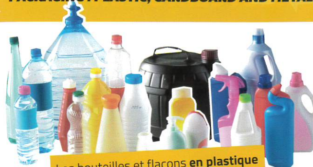
Les bouteilles et flacons en plastique