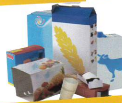
Les emballages en carton et briques alimentaires