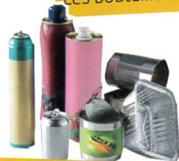
Les emballages métalliques